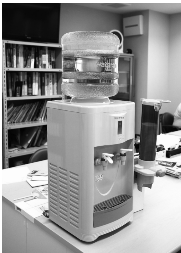
社員さん達も有効活用されています。