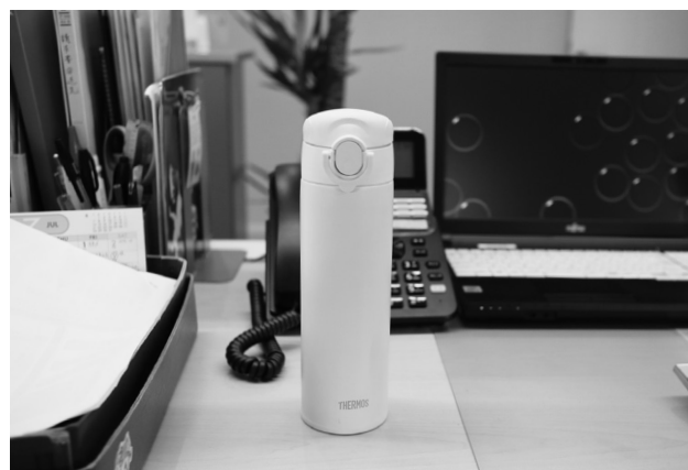
マイボトル使用も行っています。